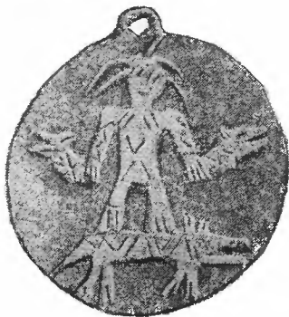
Рис. 3. Серебряная бляха с Гляденовского костыща

Среди материала с Гляденовского костыща, который можно отнести к так называемой пьяноборской эпохе (III в. до н. э.—III в. н. э.), имеется одна чрезвычайно интересная группа вещей из раскопок Н. Н. Новокрещенных 1 . В центре группы находилась круглая серебряная бляха, где изображена человекообразная фигура с головами животных в руках и птицей на голове, стоящая на звере (рис. 3). Вокруг нее были расположены 8 фигурок животных, 2 птицы, змея, 6 бляшек, круглая бронзовая пуговица,