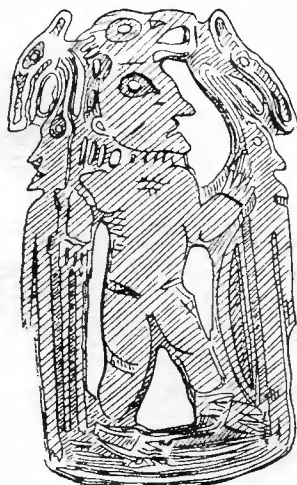
Рис. 7. «Чудский образок» Подчеремского клада

С этой точки зрения становится ясным, почему юго-восточные серебряные блюда с художественными изображениями царя-охотника, окруженного дикими зверями, так часто находились на верхней Каме. Это происходило вследствие того, что сюжет,