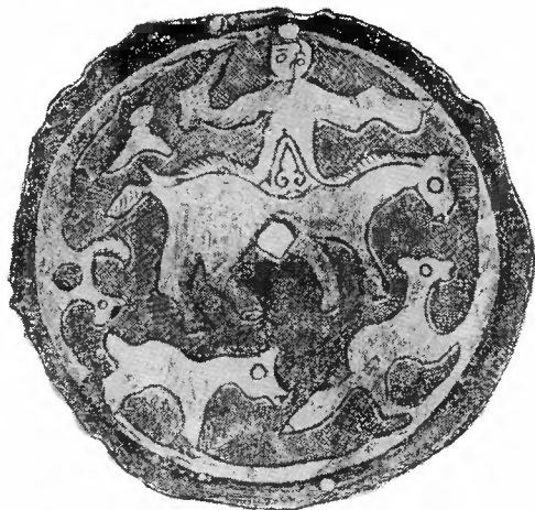
Рис. 4. Серебряная бляха из дер. Сечище (н. в.)

38 бронзовых бус, 3 ножа, 4 железных и 3 костяных наконечника стрел и несколько обломков бронзовых и железных предметов. Все эти вещи были уложены вокруг бляхи, посыпаны пеплом, и каждая из них была прикрыта черепком. На некоторых из черепков имелись следы, напоминающие следы крови. К сожалению, по фотографии, снятой Н. Н. Новокрещенных, нельзя определить, какие именно звери и птицы составляли свиту божества.