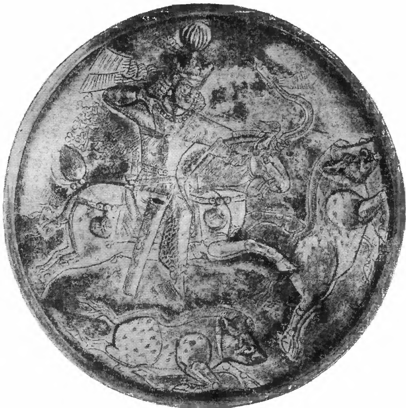
Рис. 1. Блюдо с изображением сасанидского царя на охоте

Прежде всего посмотрим, как широко и где именно распространялись находки восточного серебра в бассейне Камы. Рассмотрение карты, приложенной к атласу Я. И. Смирнова «Восточное серебро», показывает, что область распространения находок серебряных блюдец и сосудов юго-восточного происхождения поразительно совпадает с областью расселения племени, которое покойный М. В. Талицкий в своей работе 1 отождествил с племенем «вису» или «ису» арабских источников. По его мнению,