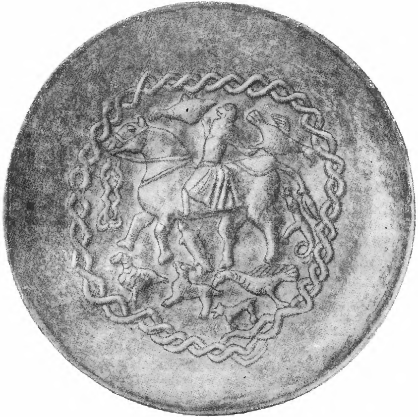
Рис. 5. Бронзовое блюдо с обезьяной на коне

тре блюд находится фигура обезьяны в женской одежде или женщины с головой обезьяны, сидящей верхом на лошади, едущей влево и окруженной животными — зверями, птицами, пресмыкающимися. Вся композиция заключена в кольцо из двух перевившихся змей (рис. 5). Не вдаваясь в дальнейший разбор вопроса о месте происхо-