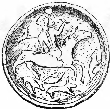
Рис. 6. Бляха с изображением мужчины-всадника

Таким образом, мы видим, что к сассанидской эпохе на верхней Каме уже сложилось представление о верховном божестве как о мужчине-охотнике, который чаще всего изображался в виде всадника, окруженного зверями. Процесс смены женского верховного божества мужским и зверя, на котором стояла богиня, конем к этому времени уже завершился.