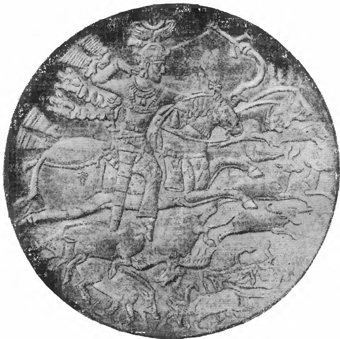
Рис. 2. Блюдо с изображением сасанидского царя на охоте

Область распространения находок восточного серебра на Каме примерно совпадает также с территорией распространения древних жертвенных мест, так называемых «костищ», некоторые из которых существовали в течение очень долгого времени 1 . Например, начало известного Гляденовского костища, расположенного недалеко от города