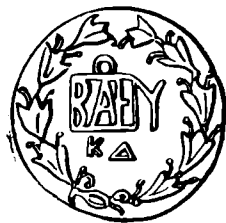
Рис. 1. Боспорская монета Котиса II