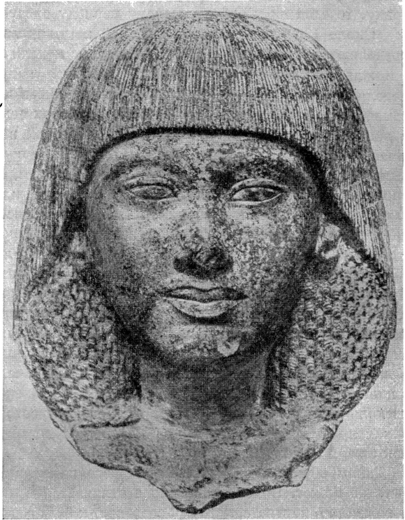
Рис. 5. Голова мужчины. Известняк. Музей в Брюсселе.

Портрет Эхнатона с хорошо нам знакомым усталым-болезненным выражением вытянутого лица, как в луврском бюсте, был создан, несомненно, в том зрелом и позднем периоде развития амарнского искусства, который последовал после 1370 г., т. е., иначе говоря, после окончательного обоснования фараона в новой столице. Изобразительное искусство, конечно, могло найти оригинальный язык лишь после того, как новые религиозно-философские идеи, выдвинутые фараоном, уже скольконибудь были усвоены. Появление этих оригинальных черт в искусстве было фактом вполне закономерным в условиях той острой классовой борьбы, которая разгорелась в Амарнский период и которая влекла за собою необходимость противопоставления и в изобразительном искусстве элементов нового канона старого, веками культивировавшегося Фи-