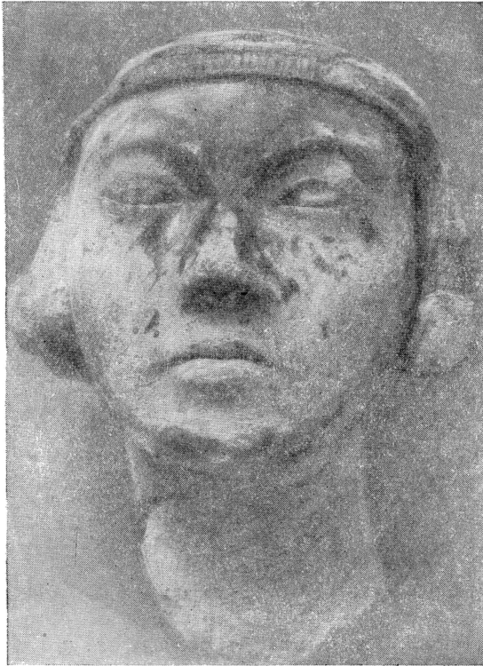
Рис. 4. Голова женщины. Скульптурная модель. Гипс. Музей в Берлине

же в статуэтке из Лувра 1 —иной. Он более вытянут и утончен по сравнению с широким в основе лицом нашей головы. Нет в нашем памятнике и столь характерного для Эхнатона отвесающего подбородка, всегда несколько болезненно-печального выражения глаз, наконец, двух традиционно изображаемых складок на шее 2 . Не подлежит сомнению, что в портретной голове, ныне находящейся в Музее изобразительных искусств,