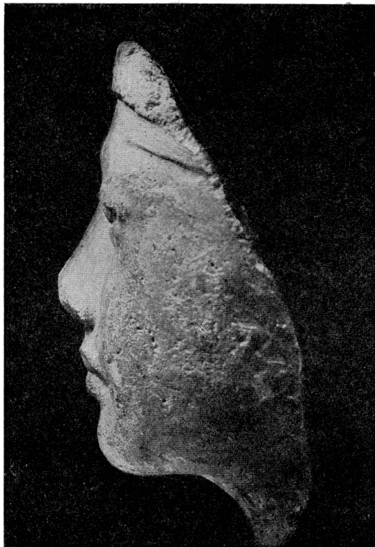
Рис. 2. Голова мужчины. Скульптурная модель. Известняк. Гос. музей изобразительных искусств им. А. С. Пушкина

Художник ставил перед собою задачу лишь портретной передачи самого лица. Отсутствуют уши. Скошена вся затылочная часть головы. В одной из откопанных Бор-