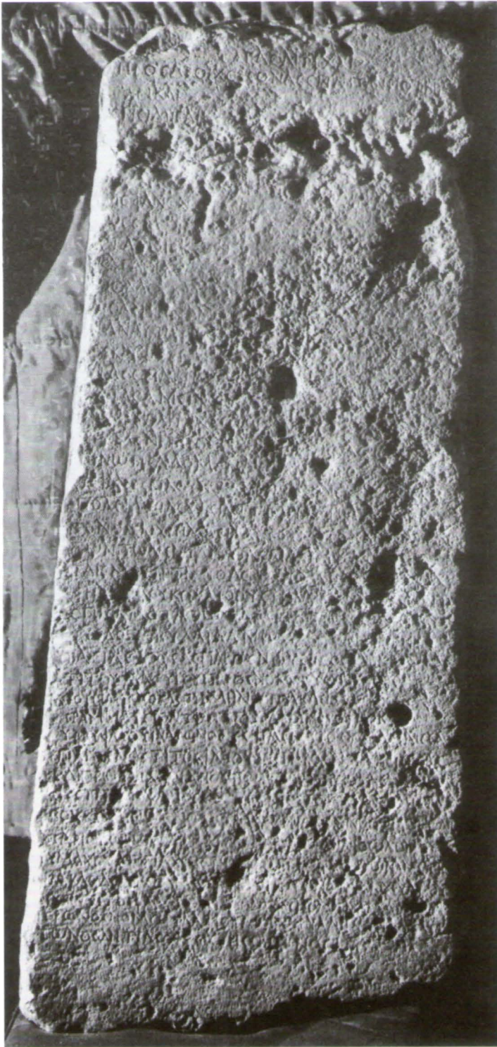
Рис. 1. Проксенический декрет херсонесцев в честь Гая Валерия..., гражданина Синопы. Начало II в. н.э.