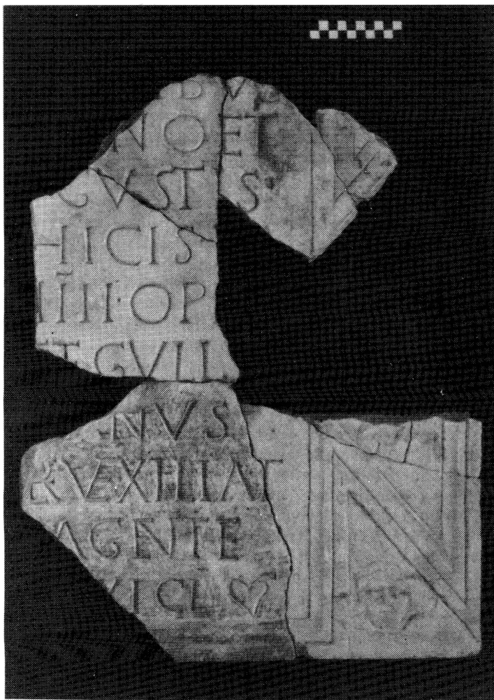
Рис. 1. Латинская строительная надпись из раскопок Харакса (фото)

памятников для древней истории Северного Причерноморья, в настоящей работе предпринимается попытка дать ее реконструкцию и на этой основе уточнить некоторые неясные вопросы римской военной организации в Таврике 6 .