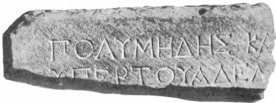
Рис. 1. Плита с надписью Полимеда

конце имеющей поперечную украшающую черточку; правая вертикаль на одну треть короче левой; у Ларфельда 1 такая форма отмечена на аттических надписях 102 и 101 г. до н. э.), Σ (с параллельными горизонтальными чертами — форма, которая на аттических надписях появляется, очевидно, после 220 г. до н. э.), Υ (верхние ответвления начинаются высоко и представляют дугобразные линии с утолщениями на концах, завершенными украшающими поперечными черточками). Таким образом, палеографические данные как будто указывают на конец эллинистической эпохи, причем легче установить предел, после которого возможно появление данного памятника, чем предел, после которого появление его становится невозможным. Этот последний устанавливается скорее всего на основании общего хода событий в истории Ольвии, а также из перечня прочих вещей комплекса, в котором был выявлен данный памятник.