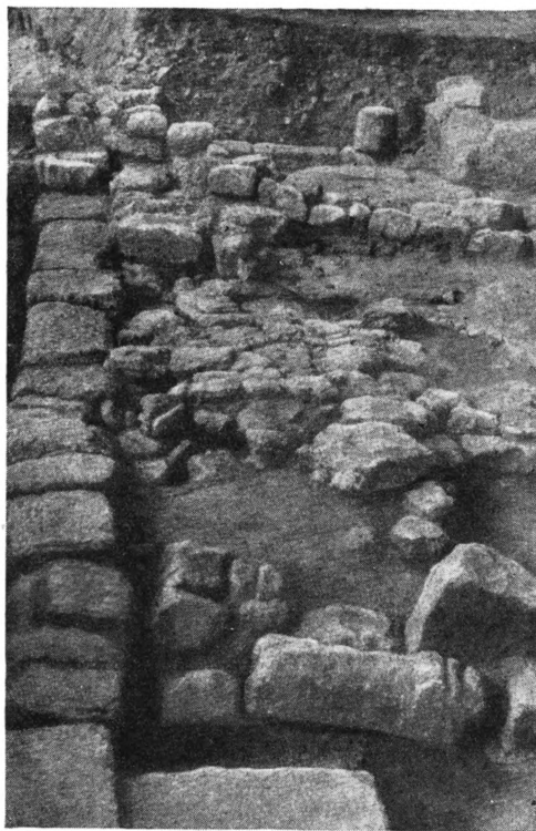
Рис. 2. Вид на западную часть двора с юга

Все перечисленные особенности подтверждают отнесение открытого дворика к первым векам н. э., устанавливаемое уже стратиграфическими данными. Точнее выяснить дату сооружения комплекса, в состав которого входил двор, позволяют предметы, обнаруженные непосредственно на плитах вымостки и частью между плитами. Наход-