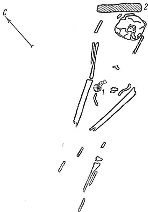
1. Сетчатый лекиф

руемого древнейшего культурного слоя городища Калос Лимен. Городище возникло, судя по находкам, на рубеже IV и III вв. до н. э. Погребальный обряд и инвентарь кургана № 1 носит типично скифский характер. Привозной греческой вещью является лишь один лекиф. Это позволяет сделать вывод, подтверждающий раскопки Л. А. Мопсеева в 1929 г., о том, что черноморская курганная группа принадлежала скифам времени возникновения Калос Лимена. Этот небольшой портовый город, первоначаль-