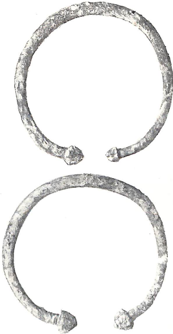
Рис. 4. Бронзовые браслеты из погребения № 1

ного сектора при повторной расчистке скальной корки погребений не обнаружено. Исследование насыпи кургана в процессе раскопок и по контрольным перемычкам показало полную однородность структуры насыпи. Курган был насыпан в один прием и был предназначен для центрального женского погребения. Обычай хоронить в ка-