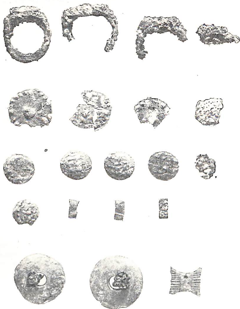
Рис. 3. Находки из погребения № 1

При зачистке контрольных перемычек в месте пересечения секторов ясно обнаружилась грабительская яма размером 2,70 × 2 м. Разборка контрольных перемычек в центре кургана была произведена по контурам грабительской ямы. На глубине 1,60 м от вершины кургана на поверхности скалы, посыпанной морскими раковинами и песком, на подстилке из морской травы лежал женский скелет в вытянутом положении