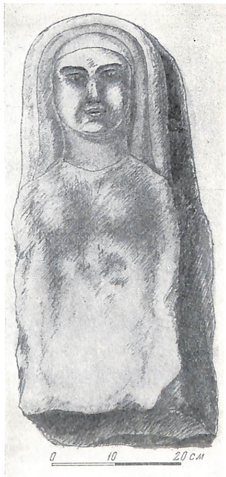
Рис. 5. Надгробие из усадьбы Соколова

та, расколота наискось пополам. № 319 описи Таманского музея (рис. 4). Размеры: выс. первой половины 26 см (с правой стороны) и 58,5 см (с левой стороны); второй половины 61 см (с правой стороны) и 21 см (с левой стороны); шпр. первой половины 54 см (верх) и 25 см (низ); второй половины—35 см (низ) и 24 см (верх); толщ. 15 см.