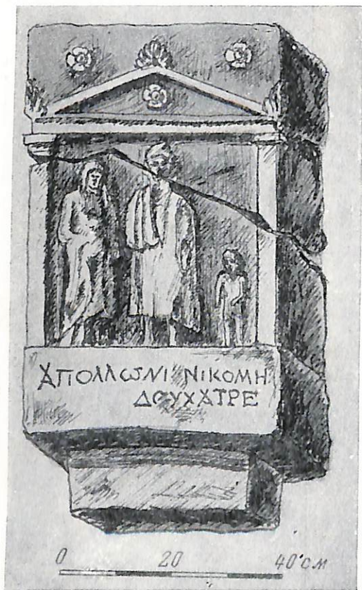
Рис. 6. Плита с греческой надписью из усадьбы Соколовой

Среди памятников юга СССР я не нашла полной аналогии. Имеется одна надгробная стела, найденная в Херсонесе (К.— В., № 766а; IOSPE, IV, 477), с надписью римского времени, с очень похожим на наш полу-бюст рельефным изображением женщины. Но здесь, насколько можно судить по фотографии, черты лица