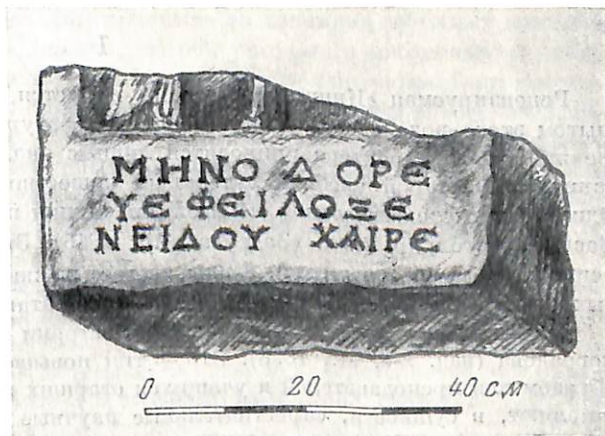
Рис. 7. Плита из городища станции Таманской