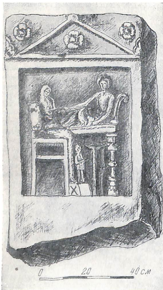
Рис. 2. Плита, найденная в «юрту» станицы Таманской

№ 2. Надгробная известняковая плита, отбитая в нижней части, № 300 описи Таманского музея (рис. № 2). Размеры: выс. левой стороны 96 см, правой стороны 82 см; шир. 58 см; толщ. 14 см. Плита украшена рельефным изображением трех фигур. Налево изображена женщина в хитоне и покрывале, сидящая в кресле в обычной траурной позе, с ногами, поставленными на скамеечку.