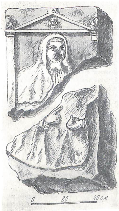
Рис. 4. Плита, найденная в коммуне «Смелая»