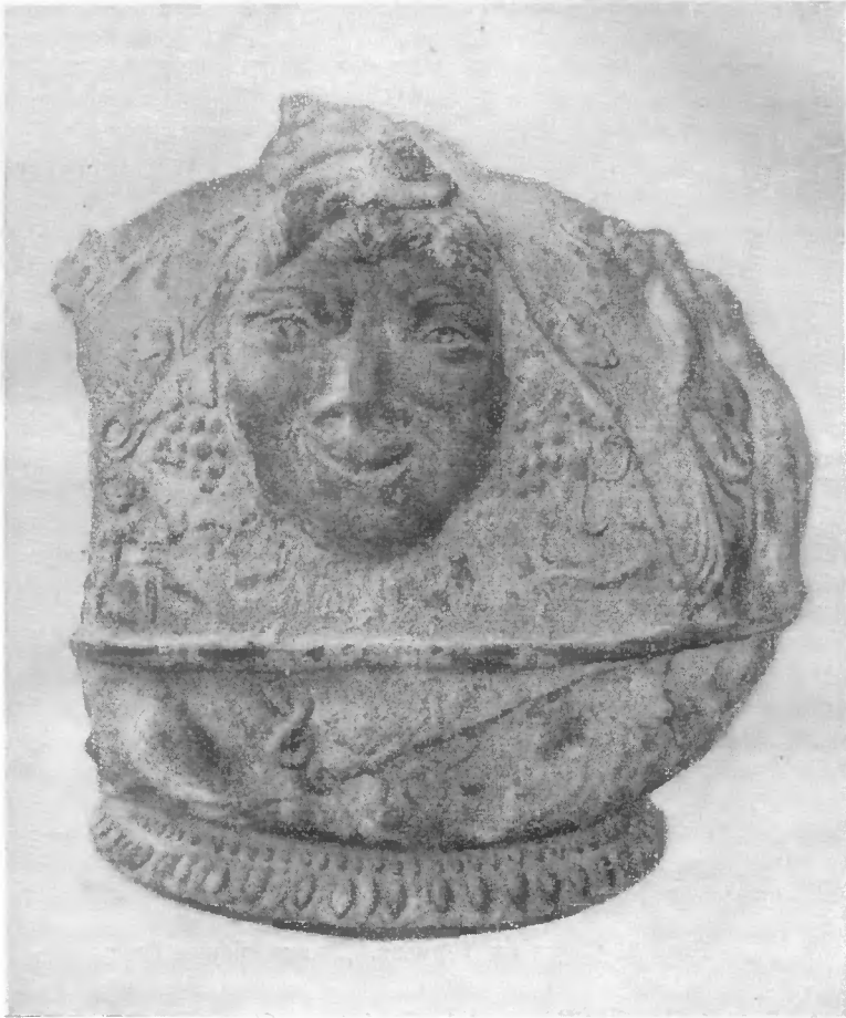
Рис. 1. Сосуд из Термеза. Голова Диониса

имел почти вертикально расположенную горловину сливника, от которого отходила ручка, прикреплявшаяся с другой стороны. Тулово овоидальное, дно плоское, с низкой кольцевой ножкой. Это так называемый аскос. Основные размеры: диаметр тулова по длинной оси — 20,5 см, по малой оси — 18 см, общая высота — 12 см, сечение черепка в изломе — 3-4 мм. Сосуд разбит на 16 кусков; восстанавливается почти полностью, за исключением большей части горловины и ручки. Постав сосуда оформляет полоса овов, а отделяющую его от тулова выкружку — шнур перлов. Тело сосуда примерно на одну треть от основания разделено на две полосы валиком.