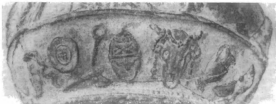
Рис. 3. Сосуд из Термеза. Цикл жертвенных атрибутов

После некоторого интервала, как раз под горловиной сосуда, — группа из двух фигур. Пьяный силен падает, пытаясь поднять выроненный канфар. Бородатое лицо изображено в профиль вправо. Лысая голова увенчана плющом. Тело — полунагое, полное, с жирным животом, задрапировано ниже бедра сползающей тканью. Пьянчугу поддерживает молодой сатир; его тело обнажено, за спиной у него шкура, развевающаяся от бурного движения.