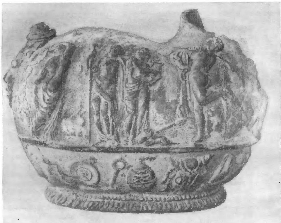
Рис. 2. Сосуд из Термеза. Дионисийский фиас

Справа от этой головы разворачивается композиция из 10 фигур (рис. 2). Сюжетом композиции является дионисийский фиас. Первая фигура изображает менаду, обращенную спиной. Голова ее повернута влево, а волосы собраны на затылке узлом, из-под которого спускаются на спину отдельные вьющиеся пряди. Правая рука, поднятая и согнутая над головой, держит небольшой бубен, левая поддерживает край длинного хитона, скрепленного на правом плече, но оставляющего открытым левое. Под тонкой тканью — гибкое, изогнутое в спиралевидном повороте тело.