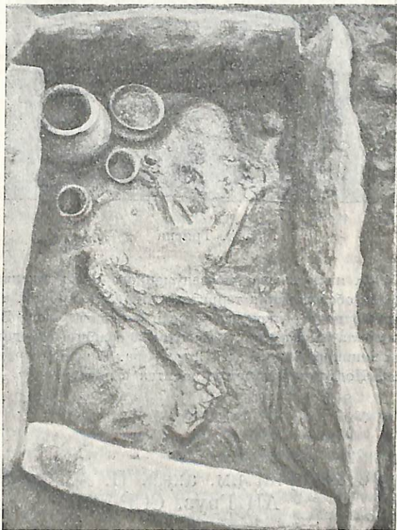
Рис. 2. Каменный ящик № 1, вид сверху

Недалеко от этого кургана экспедиция обнаружила 10 каменных ящиков, из которых четыре оказались нетронутыми (рис. 2). Ящики дали погребения в скорченном виде с богатым инвентарем. В мужском погребении был найден бронзовый кинжал хорошей сохранности, оселок, железный изогнутый ножик скифского типа и железный наконечник, быть может, копья (?). В женских погребениях были найдены бронзовая шейная гривна, многочисленные украшения, булавки, бусы и пр. Кроме того, было найдено много орнаментированных сосудов. Наличие железа при бронзовых вещах позволяет датировать эти погребения началом VIII в. до н. э.