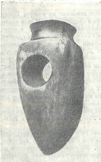
Рис. 1. Топорик из серпентина

В институте был создан студенческий археологический кружок, на котором зимой 1948/49 г. был заслушан ряд докладов по археологии и древней истории Кабарды. Летом 1949 г. была проведена при помощи Кабардинского научно-исследовательского института археологическая экспедиция. Экспедиция имела в основном разведочный характер, она состояла из трех отрядов: одного разведочного и двух для стационарных раскопок. В Кубинском районе экспедиция раскопала низкий, сильно расплывшийся курган на высоком берегу р. Малки, против сел. Кубы. На материке был обнаружен широкий круг из булыжника, что ясно указывало на бронзовый век. К сожалению, курган оказался разграбленным. Одновременно было расследовано большое городище, обнаруженное на том же высоком берегу реки Малки, восточнее сел. Кубы. Половина городища, подмытая рекой, обрушилась, со стороны степи были заметны широкие рвы. Заложенный на городище раскоп 5×5 м дал исключительно находки аланского времени с огромным числом черепков позднеаланской эпохи.