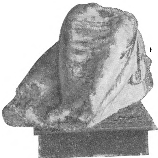
Рис. 2. Фрагмент статуи Афродиты на дельфине. Керченский музей

Нашу фигуру можно считать вотивной статуей Афродиты Урании конца III в. или начала II в. до н. э. работы местного боспорского художника, который