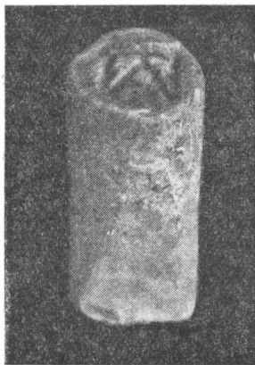
Рис. 3. Глиняный штамп для амфорных клейм.

Однако и имеющихся аналогий совершенно достаточно для того, чтобы не возникало никаких сомнений в принадлежности монограммы штампа к выделенной нами ранее группе. Теснее всего ее связывает с этой группой клеймо-монограмма, представ-