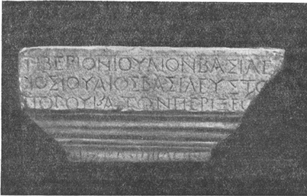
Рис. 1. Обломок мраморного постамента статуи с греческой надписью

В 1945 г., во время работ археологической экспедиции ИИМК и ГМИИ в Керчи, в одной из вырытых немцами траншей на горе Митридат (между 1 и 2 креслом) был найден обломок мраморного постамента статуи, сохранивший обрывок текста греческой надписи (рис. 1).