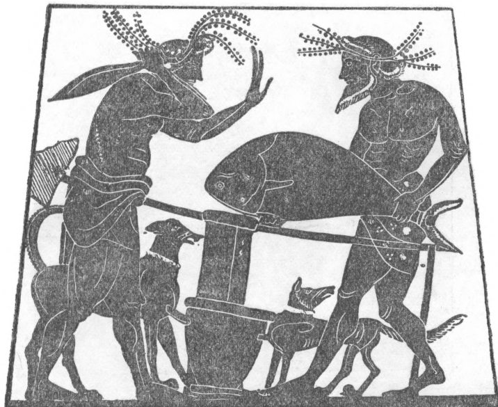
Рис. 1. Резка тунга. Чернофигурная энохия из Гульги в Берлинском музее (из Otto Keller, Die antike Tierwelt , 1913, В. II, стр. 51, фиг. 121)

Главным поставщиком рыбы являлась тихая Балаклавская бухта (Λιμὴν Συμβόλου). Здесь нужно отметить, что херсонесцы наряду с ловлей рыбы занимались добыванием соли из окрестных озер. Засоленный промысел приобрел значительные размеры в более поздние времена в результате огромного спроса на уточненные блюда из рыбы, и Херсонес превратился в место экспорта соленой и сушеной рыбы, особенно рафинированных рыбных соусов, преимущественно для вывоза за границу.