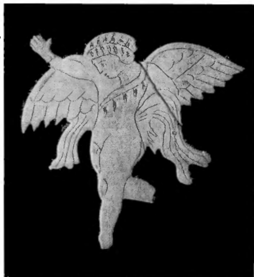
Рис. 1. Изображение Эрота на костяной пластинке из Керчи

Во время раскопок в Керчи в 1946 г. на северном склоне горы Митридат на Эс-планадной улице в слое античной мусорной свалки была найдена плоская костяная пластинка, представлявшая собою выпиленную по контуру и выгравированную фигурку Эрота. Пластинка выпилена из трубчатой кости. Толщина ее 0,25 см. Высота фигурки 6 см., и ее наибольшая ширина 6 см. Кость — желтоватого цвета, в изломе беловатая и пористая. Поверхность пластинки не отполирована (рис. 1).