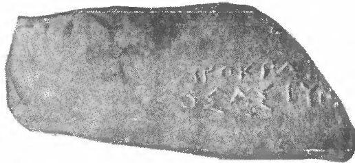
Рис. 1. Херсонесское клеймо с именем Герократа

Это имя встречается у Е. М. Придicka в «Ивентарном каталоге клейм Эрмитажного собрания», по вместе с именем Νεομήτιος (стр. 89, № 576—577). С этим же именем мы находим его и у Махова. («Амфорные ручки Херсонеса Таврического с именами астиномов». ИТУАК, 1912, № 48). Такое же клеймо издано и у Юргевича (ЗОО, XV, № 16, стр. 51). Встречается точно такое же клеймо и на черепицах (Р. Ахмеров. Клейменные черепицы древнегреческого Херсонеса, ВДИ, 1948, № 1, стр. 163). Как и все клейма херсонесской группы, это клеймо может быть датировано IV—II вв. до н. э.