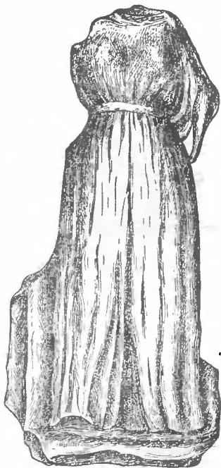
Рис. 1. Богиня Астара из памятника царицы Комосарии

Статуя Астары Кёлером измерена не была. Обмер статуи: высота 138 см; объем в самом широком месте, там, где сохранилась часть обрамления, 131 см; ширина в плечах — 22 см.