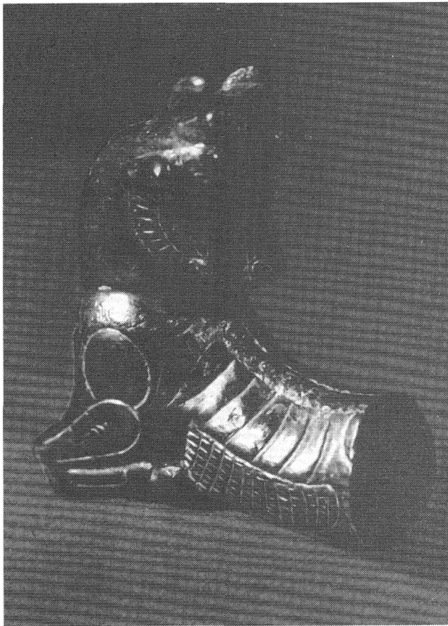
Рис. 4. Серебряная статуэтка быка с головой, повернутой назад (10/862).

10/862. Статуэтка серебряная: бык, обернувший голову назад (рис. 4). Миндалевидные глаза с глазным яблоком, челка в виде орнаментальных треугольных насечек, каплевидные мышцы справа над губой. Рога короткие, закругляясь, обращены вперед. Передние ноги плотно подогнуты. Грива, завитая на концах. На шее спереди грива в виде обращенных в разные стороны каплевидных полуовалов с точками в центрах. На теле с боков от «позвоночника» гравировкой показаны овалы с округлыми «ребрами» как у тахтисангинского льва на ножнах № 1000 18 . Каплевидные мышцы на плечах, другие – с раздвоенными концами на предплечьях. Внизу фалл.