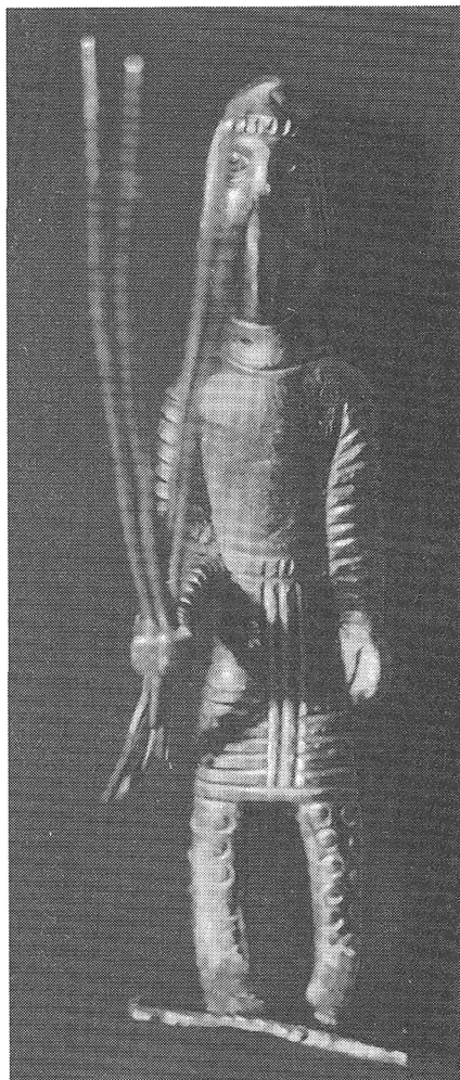
Рис. 3. Золотая статуэтка жреца (4/149)

То же, что и № 4/149 и 5/150. Сделаны, определенно, одним мастером. Другим мастером изготовлены статуэтки ОТ-1 № 7, 7а – жрецов в кандизах с короткими прутками барсома в руке 16 . Известны подобные изображения и на рельефах монументального искусства 17 .