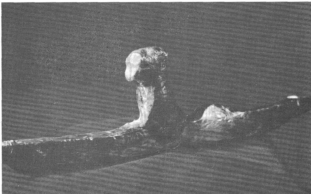
Рис. 5. Ритуальный кастет, железо с серебряной плакировкой (17/866)

16/154. Статуэтка серебряная, расплющенная проволока: кобра, свившаяся в полтора круга с поднятой расплющенной головой. Змея сделана из утончающейся к хвосту серебряной проволоки. Головка передана очень правдоподобно: расплющена, с небольшим утолщением к центру и утончениями на концах, рот моделирован едва заметной прорезью, глаза переданы точками.