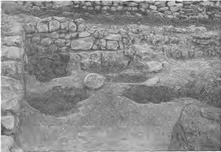
Рис. 4. Кладовая. В полу гнезда для пифосов.

ческие памятники эллинистического времени (амфорные ручки с клеймами, синопские, книдские, фасосские и херсонесские, обломки чернолаковой посуды и др.) найдены были в верхних слоях. Определить характер первого поселения, занятие жителей и пр. не представляется возможным. Соотношение строительных остатков эллинистического и последующего за ним римского времени свидетельствует о перерыве жизни в этом месте. Над эллинистической стеной успел образоваться значительный слой земли в 0,20—0,30 м, когда была построена стена римского времени (рис. 2). Керамический материал подтверждает наше предположение о перерыве жизни в этом месте. Наиболее ранняя краснолаковая посуда с клеймами на дне в виде ступни человека, тарелки с крутоизломанными краями относятся к началу I в. н. э.