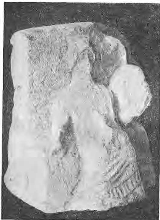
Рис. 3. Кибела, \frac{1}{3} нат. величины.

Второй период существования поселения у Стрелецкой бухты начинается в середине III в. до н. э. распланировкой всей территории на водоразделе между Стрелецкой и Песочной бухтами, постройкой оград полей и коренной перестройкой ранее существовавшего «рыбного завода». Возникает поселение нового типа — «усадьба», как назвал ее А. К. Тахтай. «Усадьба» состояла из 4 домов, обнесенных каменной оградой. Лучшей сохранности из обнаруженных домов — «ожный дом»; он состоял из двух помещений; одно помещение, с подвалом, было кладовой, второе помещение было, вероятно, жилым. В доме найдено большое количество черепиц, указывающих, что