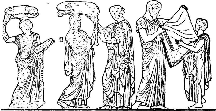
Рис. 3. Одна из плит фриза Парфенона

Работа над изготовлением пеплоса начиналась за девять месяцев до наступления Панафиней, во время праздника, который назывался χαλκεία и который справлялся в месяце Пианепсионе (октябрь—ноябрь). В последний день этого месяца (14 ноября) жрица Афины вместе с аррефорами (иначе—эррефорами), девочками 7—11-летнего возраста, посвящаемыми на служение Афине, в течение года πέπλον διάρουνται (Свида, χαλκεία II = Etym. magn. , 805, 43 сл.), натягивают нити на ткацкий станок и начинают ткать. Гарпократион (п. сл. ἀρρηφορέϊν , ср. В е к к е r— Анеcd. , I, 202,3; 446,18; Etym. magn. , 149, 19 сл.) добавляет, что из 4 аррефор,