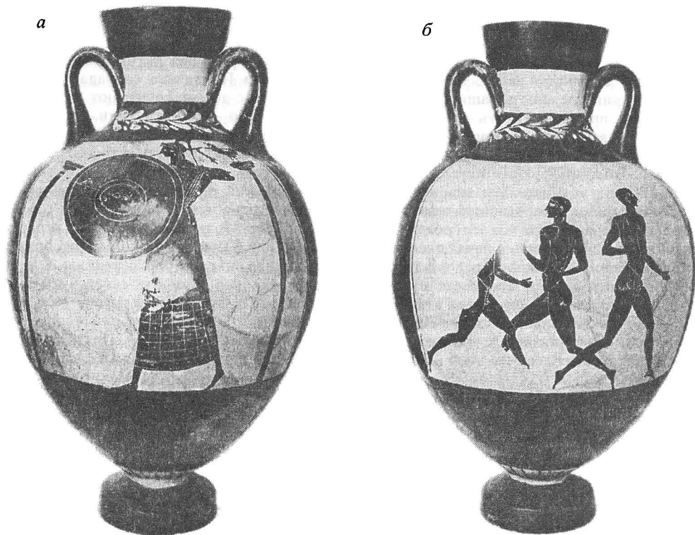
Рис. 2а, б. Панафинейская амфора 6Кр-IV

выстроившись в линию, должны были бежать определенную дистанцию до финиша или, повернув вокруг этой точки, отмеченной столбом или камнем, бежать обратно к месту старта. В первом случае мы имеем стадий или прямой бег, во втором – диаулос и другие виды бега с поворотом, «κάρπειος» как называли их греки. Кроме этих универсальных видов были еще бег в вооружении и различные церемониальные виды, например, факельный бег.