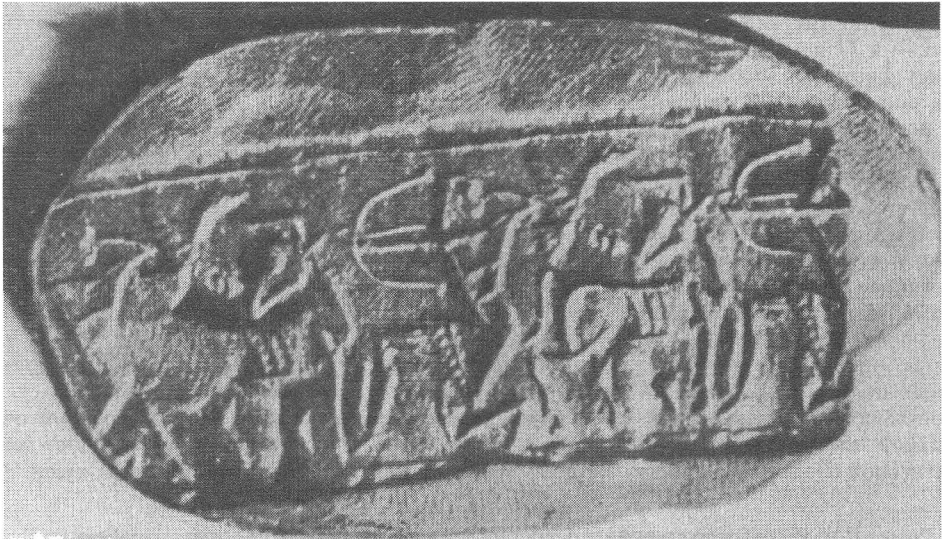
Рис. Ассирийская печать из Эребуни с изображением сцены охоты. Светло-желтый тальк. Высота 3,7 см, диаметр 1,3 см. Ереван, Государственный Исторический музей Армении.