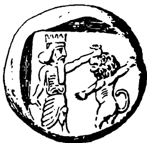
Рис. 4. Монета Сидона. IV в. до н.э. Прорисовка

месте Ер-Кургана города Бранхидов они приобретают важную историческую значимость.