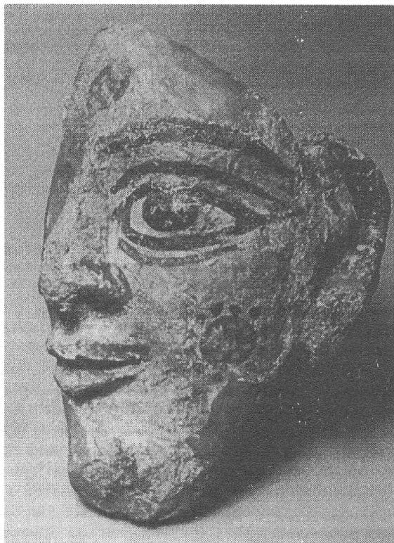
Рис. 2. Голова божества. Фрагмент скульптуры. Глина. Ер-Курган (Южный Согд). II–III в.н.э.

длинным носом; глаза, зрачки и брови переданы черной и красной красками 32 (рис. 2). Эта находка, не имеющая аналогий в скульптуре древней Средней Азии, обладает определенным сходством с архаической греческой скульптурой. Я понимаю всю условность подобного сопоставления, но сохранение в условиях изоляции от метрополии весьма древних черт культуры и искусства у небольших коллективов – явление достаточно широко распространенное и зафиксированное неоднократно. Не является ли эта скульптурная голова частным примером подобного феномена?