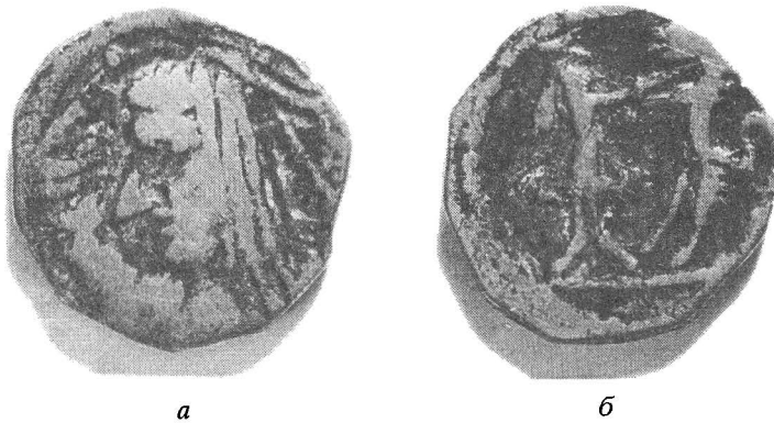
Рис. 3. Монета Кеша III–IV вв. н.э.: а – avers; б – revers