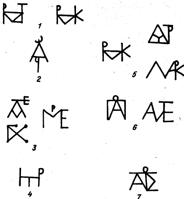
Рис. 2. Монограммы на монетах Малой Азии II-I вв. до н.э.

шкуре – Ника» 62 (табл. I, 12), которые в Амисе изготавливались также из латуни 63 . Исследованная нами монета того же типа, но чеканенная в Синопе, не содержит цинка, а сделана из «понтийской» бронзы. На основании этих наблюдений можно высказать предположение, что, вероятно, первый массовый преднамеренный выпуск латунных монет был осуществлен в 90–80 гг. до н.э. в Амисе и Дии и охватывал только монеты определенного типа, а именно: «Дионис – циста». Относительно большое количество известных монет этого типа, а также многочисленные и разнообразные монограммы на них свидетельствуют о достаточно длительном времени их чеканки.