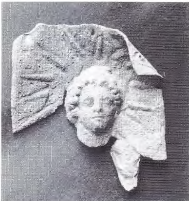
Рис. 1. Серебряная пластина из храма Окса