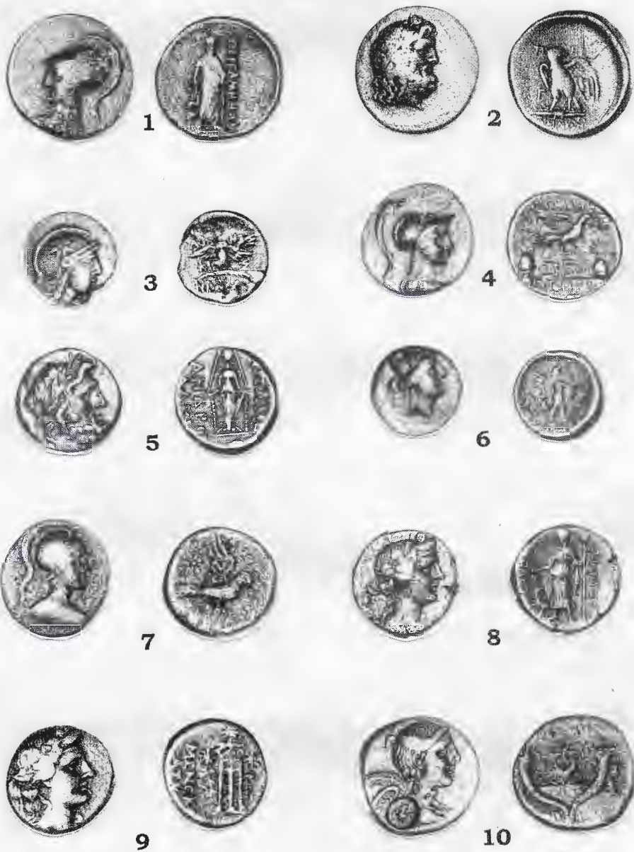
Табл. II. Монеты Пергама и городов Фригии первой половины I в. до н.э.