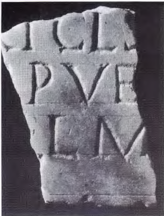
Рис. Новая латинская надпись из Херсонеса