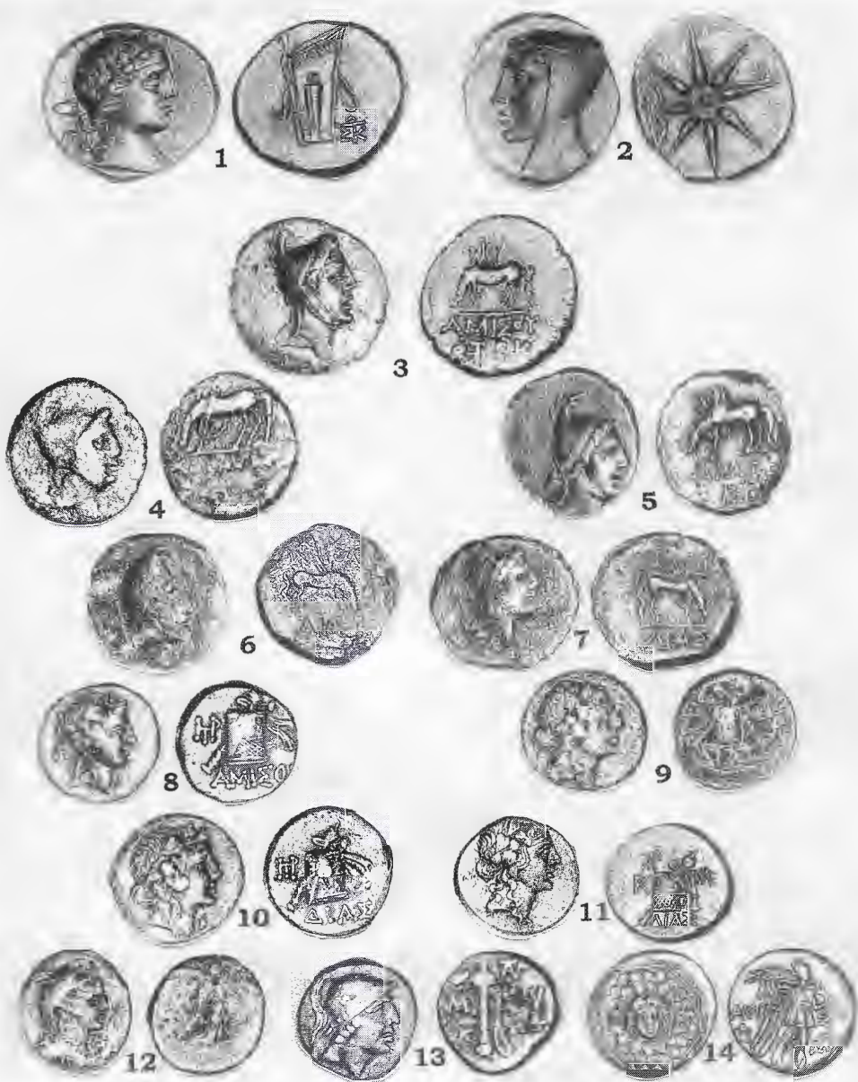
Табл. I. Боспорские и понтийские монеты первой половины I в. до н.э.