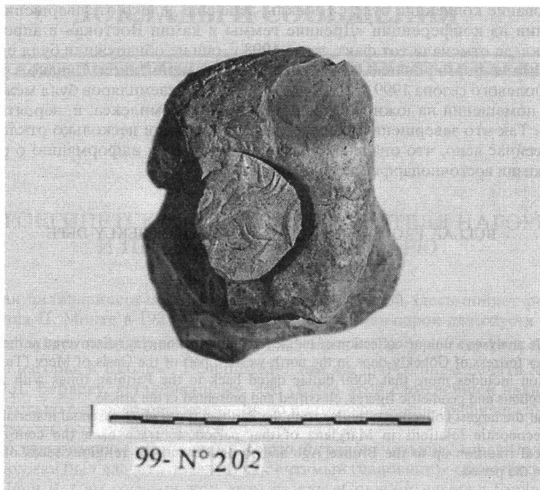
Рис. 3. Глиняная печать с Гебеклы-депе

ружена серия (4 экземпляра) булл, оттиснутых одной печатью, с изображением сцены инвеституры (?) царя женским божеством (рис. 2, 6). Оба персонажа стоят перед находящимся между ними алтарем огня, а позади каждого из них имеется надпись, представляющая собой, вероятно (это выяснится после прочтения надписи), имена участников церемонии.