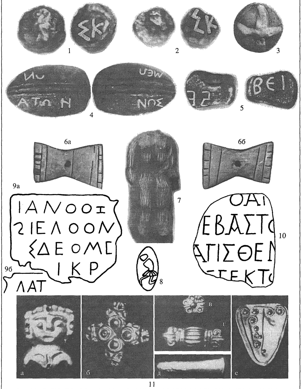
Табл. II. Памятники материальной культуры из Никония (масштабы разные)