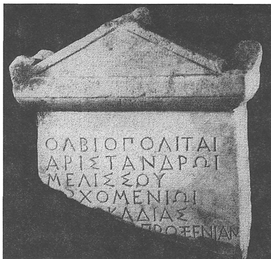
Рис. 3. Ольвийская проксения орхоменцу Аристандру

ти консулов нового времени 44 . Сравнение текстов проксений разных полисов показывает, что их составляли по строго определенным формулам, которые незначительно изменялись на протяжении многих веков. В римский период проксении постепенно утрачивали первоначальное значение и часто превращались в почетные титулы 45 . Обычно льготы, предоставлявшиеся проксениями, включали освобождение от налогов на ввозимые и вывозимые товары, а также освобождение от уплаты гаванных сборов. Часто проксен получал еще гражданство, уравнивавшее его во всех правах с полноправными жителями дружественного города. Иногда льготы распространялись на братьев и сыновей проксена, а торговыми преимуществами могли по его поручению пользоваться слуги 46 .