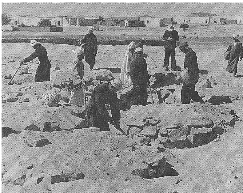
Рис. 3. Египет, 1962 г. Раскопки у с. Наг-Набрук