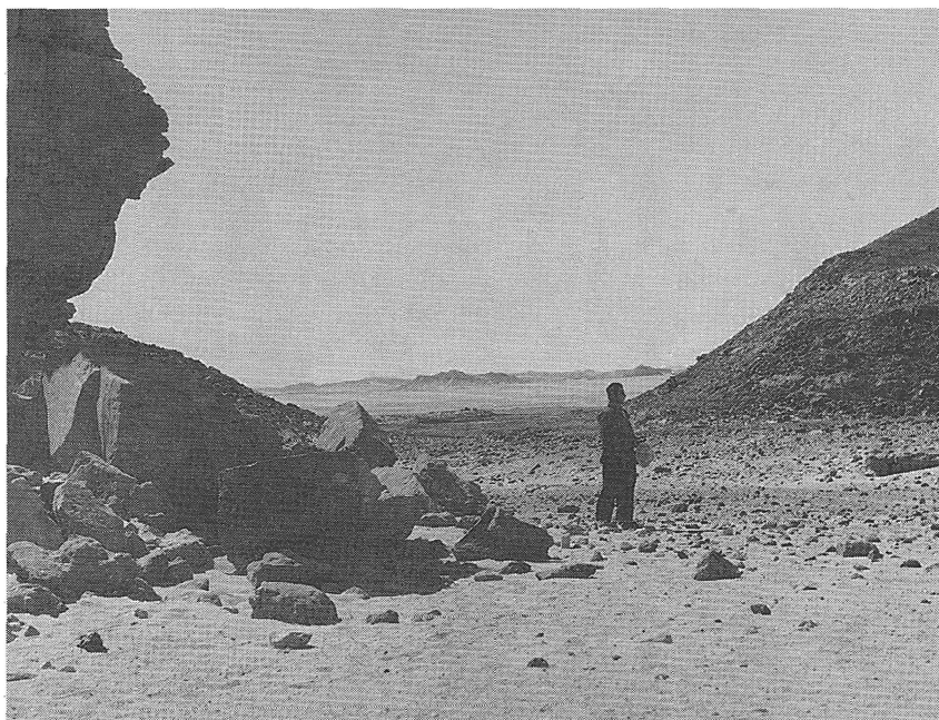
Рис. 4. Египет, 1962 г. Устье Вади Аллаки