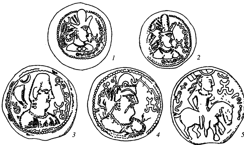
Рис. 3, 1–5. Символ «лунной повозки» на хионитских монетах (по: E. Specht , 1901; H.H. Wilson , 1971)

Шапура», но и с изображением всадника (группа С – монеты царей Забула, по Р. Гиршману) 49 (рис. 3, 5). Следует отметить, что среди хионитских (эфталитских) подражаний монетам Шапура II имеются монеты с тем же типом оборотной стороны, что и на вышеупомянутых кушано-сасанидских монетах Пероза и Хормизда – алтарь с божеством в пламени 50 . Это позволяет относительно синхронизировать данные группы монет и не предполагать большого промежутка времени между их выпусками, что также может указывать на некоторое омоложение даты правления кушаншахов Пероза и Хормизда (см. прим. 46).