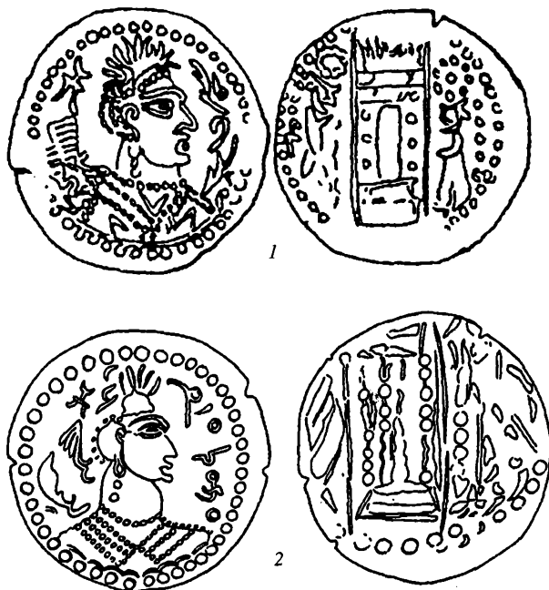
Рис. 4. Символ «лунной повозки» на монетах NAPKI MALKА (1) и князя Бамиана (2) (по: R. Ghirshman, 1948)

и на севере Индии – с указанным монетным чеканом АЛХОН, и в бывшей Бактрии, в Тохаристане – с чеканом ГОВОЗИКО) и эфталитского княжеств, царства Кидары. Вместе с тем, Б.И. Вайнберг считала, что племенная группировка, чеканившая монеты с надписью ГОВОЗИКО и самостоятельной тамгой (S2 по Р. Геблю), вышла из объединения АЛХОН, и предположила, что в конце 80-х годов IV в. именно хиониты группировки ГОВОЗИКО сменяют власть кушано-сасанидских правителей в Бактрии-Тохаристане 54 . В связи с новой датировкой кушано-сасанидских монет очевидно, что данные рассуждения нуждаются в хронологической и исторической коррекции. Прежде всего следует говорить об удревнении этой группы монет и их относительной датировке серединой IV в. 55