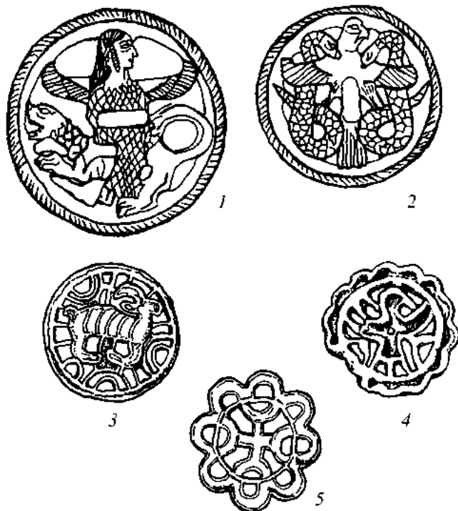
Рис. 1. Металлические печати из погребений некрополя Гонура (по В.И. Сарьяниди)

Другие выявленные варианты оформления ободка дают более или менее близкий набор таких мотивов. Остается обратить внимание на интересную деталь: гладкие обрамления, как правило, имеют два бортика – внутренний и внешний, т.е. в них воплощается та же идея сочетания (в основном, хотя есть и более сложные варианты) двух полос, что и в жгутовидных вариантах, однако, она выражена иным, более простым в исполнении способом. Таковы обрамления фигур крылатых мужских и женских персонажей, иногда изображавшихся с животными (2, 3, 6–8, 10–14, 17, 19, 20, 37, 40). Примечательно, что на образцах из Бактрии таким образом оформлены довольно многочисленные изображения обезьян (68–73).