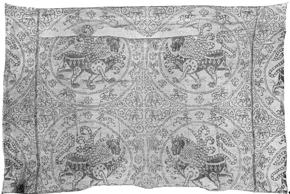
Рис. 1. Иранская ткань VIII–IX в., покрытая шитьем XII в. (лицевая сторона)