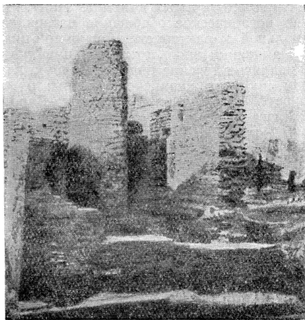
Рис. 3. Раскрытые остатки сооружений в Мохенджо-Даро

Основное строение в Харappe из более или менее сохранившихся представляет собою в восточной части 12 параллельных стен, с определенными интервалами между каждой парой. До сих пор не установлено точно, каково могло быть назначение столь обширного помещения.