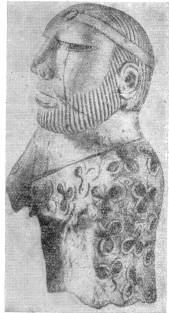
Рис. 1. Статуэтка мужского божества с характерным убором волос