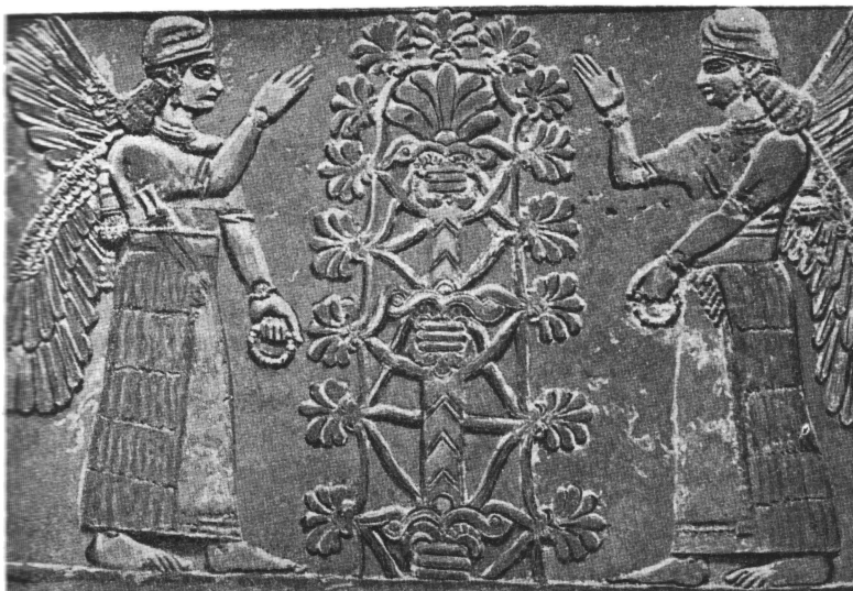
Два женских ангела у (стилизованного) небесного дерева. Ассирийский алебастровый рельеф. Бригганский музей. Лондон

Однако в древнеарабской религии должен существовать и другой вариант, объясняющий рождение верховной парой богов бесконечного множества детей вкушением плода, который обладает свойством способен стимулировать производительную силу. Такие плоды хорошо известны в семитических и библейских преданиях, и изображения небесного сада богов показывают, что здесь, кроме «дерева жизни», существовало еще дерево с такими любовными плодами, которые представляли жизненную необходимость для божественных отца и матери, но были «табу» для их детей, не предназначенных для вступления в брак или познания тайны половой любви.