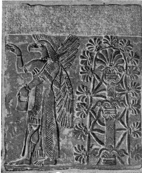
Ангел с птичьей головой подносит священный плод. Ассирийский алебастровый рельеф в Национальном музее в Копенгагене

Та стадия развития мифологии, которая подтверждается найденной в Угарите литературой, представляет собою мост между древнеаравской и библейской мифологиями, отсутствовавшее до настоящего времени звено (missing link), соединяющее эти обе формы религии.