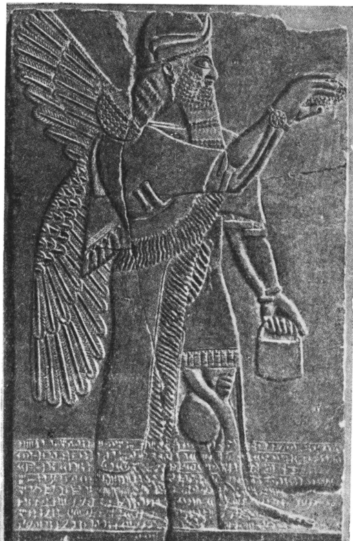
Длиннобородый ангел ассирийского типа со священным плодом (плодом дерева познания?). Ассирийский алебастровый рельеф. Лувр

также и в более поздних текстах. Оно хорошо известно и Библии, где упоминания о «древе жизни» встречаются, начиная с первой и до последней страницы. Это дерево встречается уже в саду Эдем или в раю 2-й и 3-й глав кн. Бытия; по Иезекилию (XXVIII, 13) и по Откровению Иоанна этот рай находится на небе и соответствует небесному саду богов, существующему в других религиях. Здесь растет чудесное «дерево жизни» (Апокал., 22, 2), это «дерево жизни, находящееся в раю божьем» (Апокал., 2, 7).